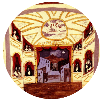
Décors du Ballet par Pablo Picasso, 1920